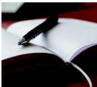
מזכירות סטודנטים <