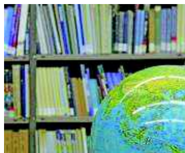
ספרים ואוספים- מידע כללי <