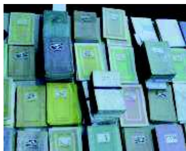
אוספי המפות <